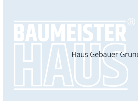
Haus Gebauer Grundriss OG