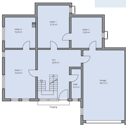
Haus Schönherr Grundriss