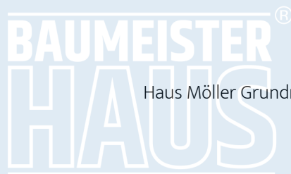
Haus Möller Grundriss