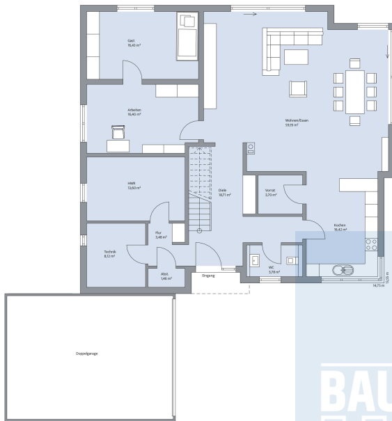
Haus Abendroth Grundriss